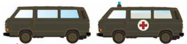
Limitiert 300 LC4337 VW T3 Set Militär Schweiz UVP 21,98 €