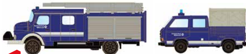
Limitiert 500 LC4205 LF 16 TS + VW T3 THW UVP 39,90 €