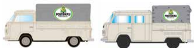
Limitiert 350 LC3899 VW T2 Set Postbräu UVP 19,95 €