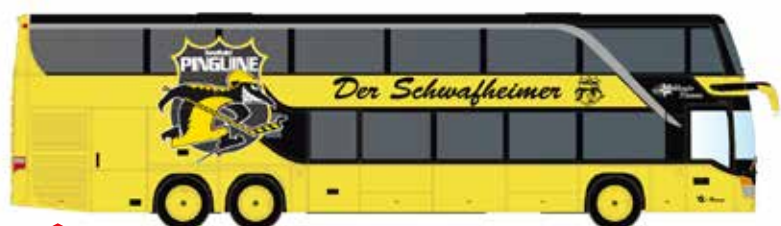
Limitiert 400 LC4477 SETRA S 431 DT KEV Mannschaftsbus Krefelder Pinguine UVP 29,98 €

Bedeutung gewann der S 431 DT insbesondere durch das stark wachsende Fernbusgeschäft.