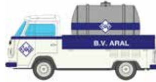
Limitiert 400 LC3893 VW T2 Tankwagen ARAL UVP 11,99 €