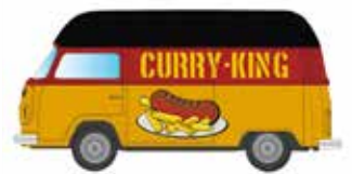
Limitiert 400 LC3876 VW T2 Imbiss-Wagen UVP 11,99 €