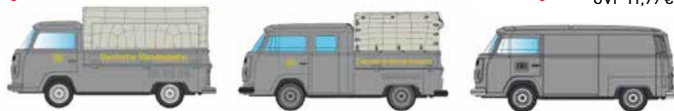
Limitiert 350 LC3871 VW T2 3-er Set DB UVP 29,95 €