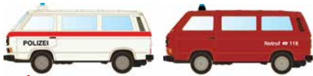
Limitiert 300 LC4335 VW T3 Set Polizei -Feuerwehr Schweiz UVP 21,98 €